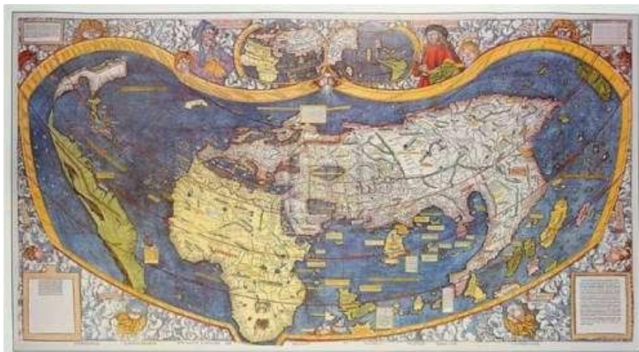
Universalis Cosmographia o Planisferio de Waldseemüller es un planisferio publicado bajo la dirección

A continuación, en la imagen del año 1507 se representa a América como una estrecha franja alargada e imprecisa, correspondiente a una etapa de exploración, ocupación y organización del territorio posterior a la llegada de Cristóbal Colón.