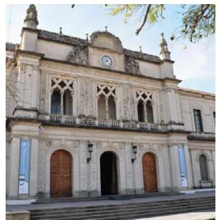
La Universidad Nacional del Litoral, hija de la Reforma de 1918. Edificio de Rectorado de la Universidad Nacional del Litoral.