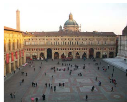
Los orígenes de la Universidad. Universidad de Bolonia, fundada en 1088.