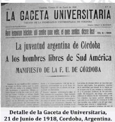
Detalle de la Gaceta de Universitaria, 21 de junio de 1918, Córdoba, Argentina. Los orígenes de la Universidad. Publicación en la Gaceta Universitaria del Manifiesto Liminar del Movimiento de la Reforma de 1918.