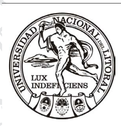
Efebo de la UNL.