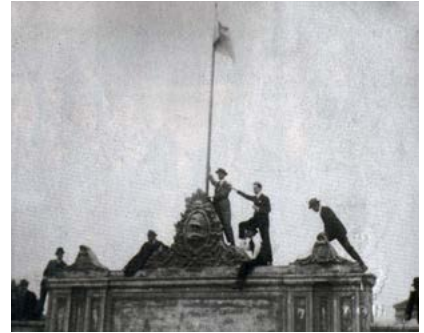
El Movimiento de Reforma de 1918. Toma del edificio del Rectorado de la universidad de Córdoba por los estudiantes.