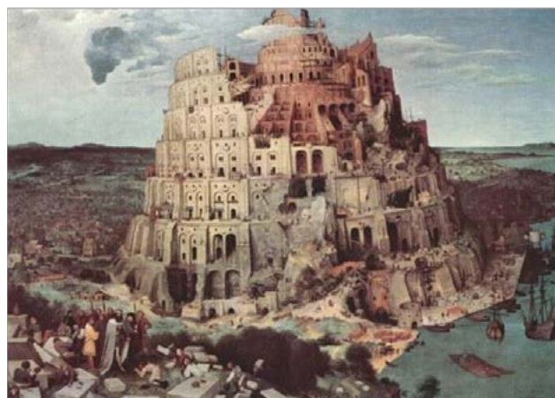
La torre de Babel ( Pieter Bruegel el Viejo – 1563). Museo de Historia del Arte de Viena .