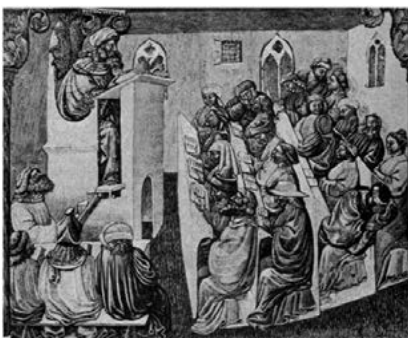
Los orígenes de la Universidad. Pintura de una clase en la Universidad de Bolonia, durante el período Medieval.