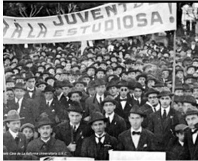
El Movimiento de Reforma de 1918. Protesta estudiantil durante los sucesos de Córdoba.