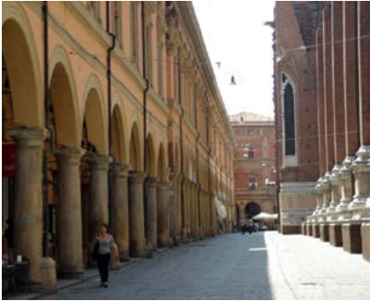
Los orígenes de la Universidad. Universidad de Bologna, fundada en 1088 (vista desde los patios).