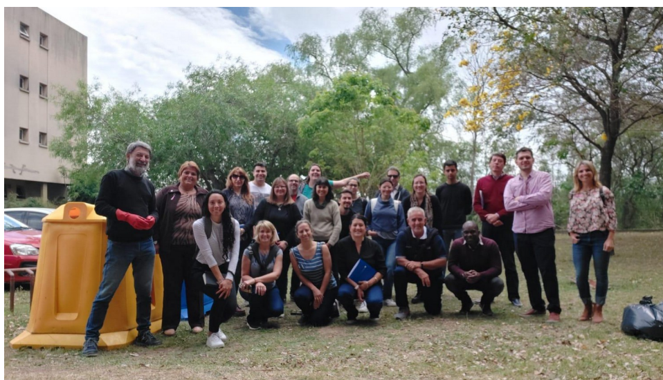
Figura: Equipo interdisciplinario que llevó adelante un estudio de caracterización de residuos, en forma participativa, en la FICH UNL.

Por su parte, en el caso de la Facultad de Ingeniería Química (FIQ), se ha abordado la problemática del uso racional y eficiente de la energía eléctrica, conformando un equipo de trabajo interdisciplinario integrado por docentes especialistas de la FIQ y de la Escuela Industrial Superior, responsables de gestión de las áreas de planificación institucional, higiene y seguridad y de comunicación y también personal Nodocente. El objetivo de este trabajo consistió en promover un marco institucional para el desarrollo de acciones de mejora en cuanto a la gestión de la energía en el ámbito de la FIQ, incentivando tanto la participación de la comunidad como las modificaciones de procedimientos requeridos con vistas a alcanzar una mayor eficiencia energética.