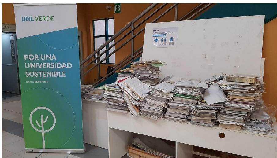
Figura: Campaña de reciclado de papel 2022, Facultad de Ciencias Económicas

Asimismo, las Campañas de recolección y reciclaje de papel tienen como objetivo generar conciencia en la comunidad universitaria y garantizar un circuito de recolección diferenciada que permita el reciclaje de materiales. Con 12 años de continuidad se han recolectado más de 28.000 kg de papel y cartón reciclados. En la edición 2022 además, se realizaron talleres de reciclado de papel con escuelas de nivel primario y secundario.