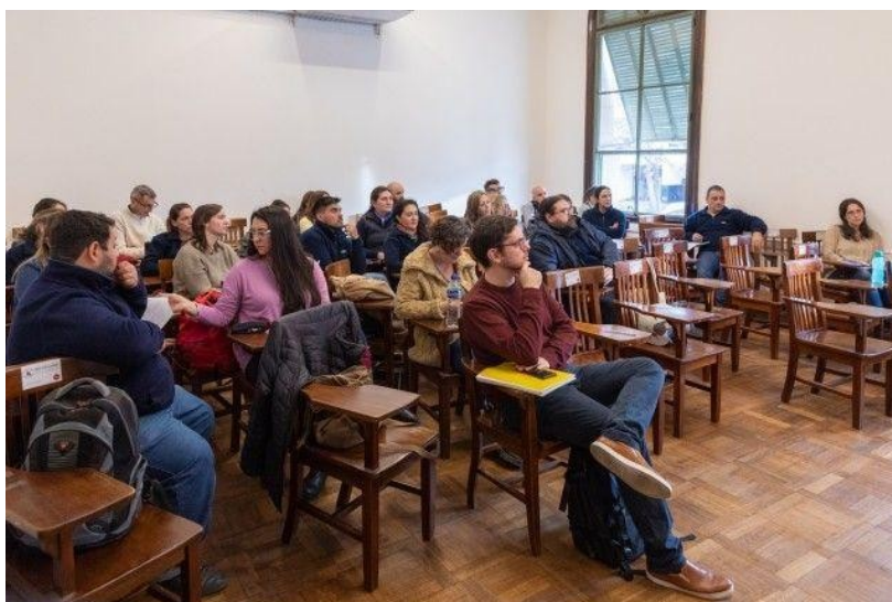
Figura: cursos UNL-APUL desarrollados en 2022 sobre Gestión de Residuos

Se destacan ciertas capacitaciones vinculadas a la temática. Entre 2020 y 2022 se dictaron los siguientes cursos y talleres: En Bici al Trabajo. Movilidad Sustentable; Introducción a la Gestión Integral de Residuos (51 agentes capacitados sobre temáticas relacionadas al vínculo entre la gestión integral de residuos y el desarrollo sostenible); Riesgo Químico; Riesgo de Incendio. Uso de extintores portátiles; Manipulación higiénica de los alimentos.