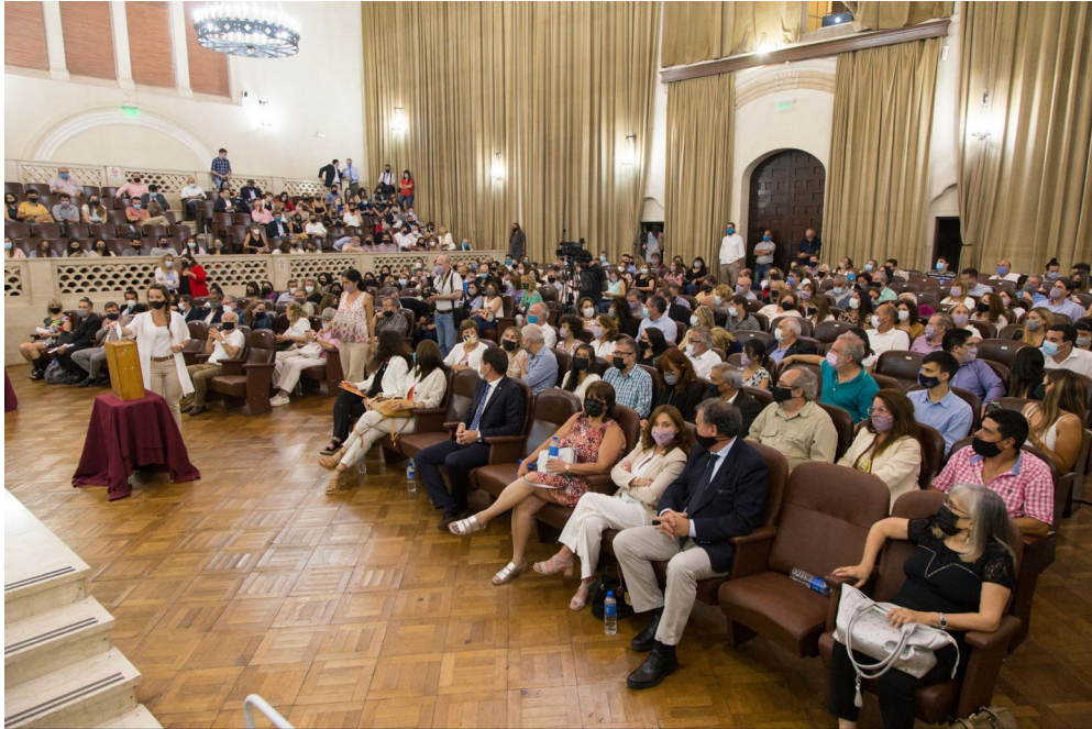
Figura: Asamblea Universitaria UNL 2021

Otras iniciativas de impacto de este período fueron realizadas por el Programa Graduados , que durante 2021, junto a LitusTV, produjo la cuarta temporada de Diálogos, micro de entrevistas de las que participaron todas las unidades académicas, donde se abordaron los ODS desde una mirada regional a partir de aportes de los profesionales, especialistas y docentes con el objetivo de resolver los problemas con una mirada de sostenibilidad. En junio de 2022 se desarrolló la cuarta edición del “Foro de Graduados y Graduadas de la Universidad Nacional del Litoral” con foco en cuatro ODS, titulada “Universidad por el Desarrollo Sostenible”. La propuesta se basó en la concreción de charlas, conferencias y conversatorios con eje en Desarrollo Humano, Estado y Políticas Públicas, Procesos Productivos y Ambiente.