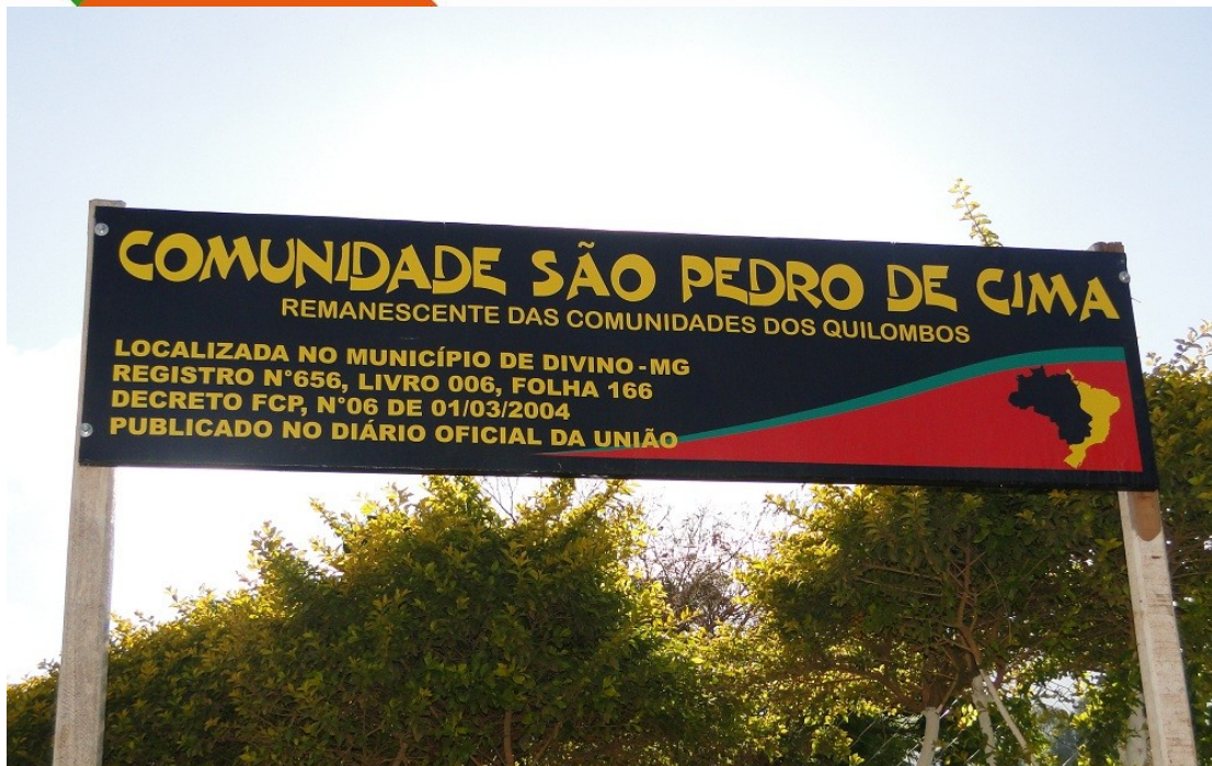
Placa de identificação da comunidade

A lei 10.639/2003 é uma conquista do movimento negro nacional, a fim de inserir no currículo escolar.