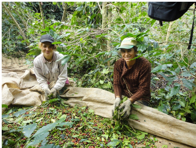
Panha do café

Cabe destacar um momento importante vivido nas últimas idas a campo. As últimas idas foram realizadas no mês de julho e agosto uma época em que a comunidade se volta para a “panha” do café. E, um aspecto muito importante é a massiva participação das mulheres neste momento, onde, além de trabalharem em seus afazeres domésticos participam de forma igualitária na “panha” de café.