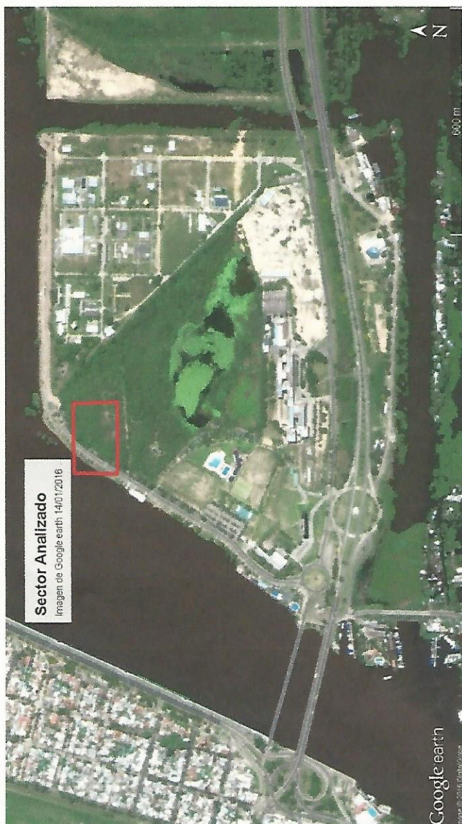
Figura N°2 – Imagen de Google Earth correspondiente a última crecida extraordinaria del Río Paraná.

Con esto se le confiere al sector a intervenir la condición de NO INUNDABLE.