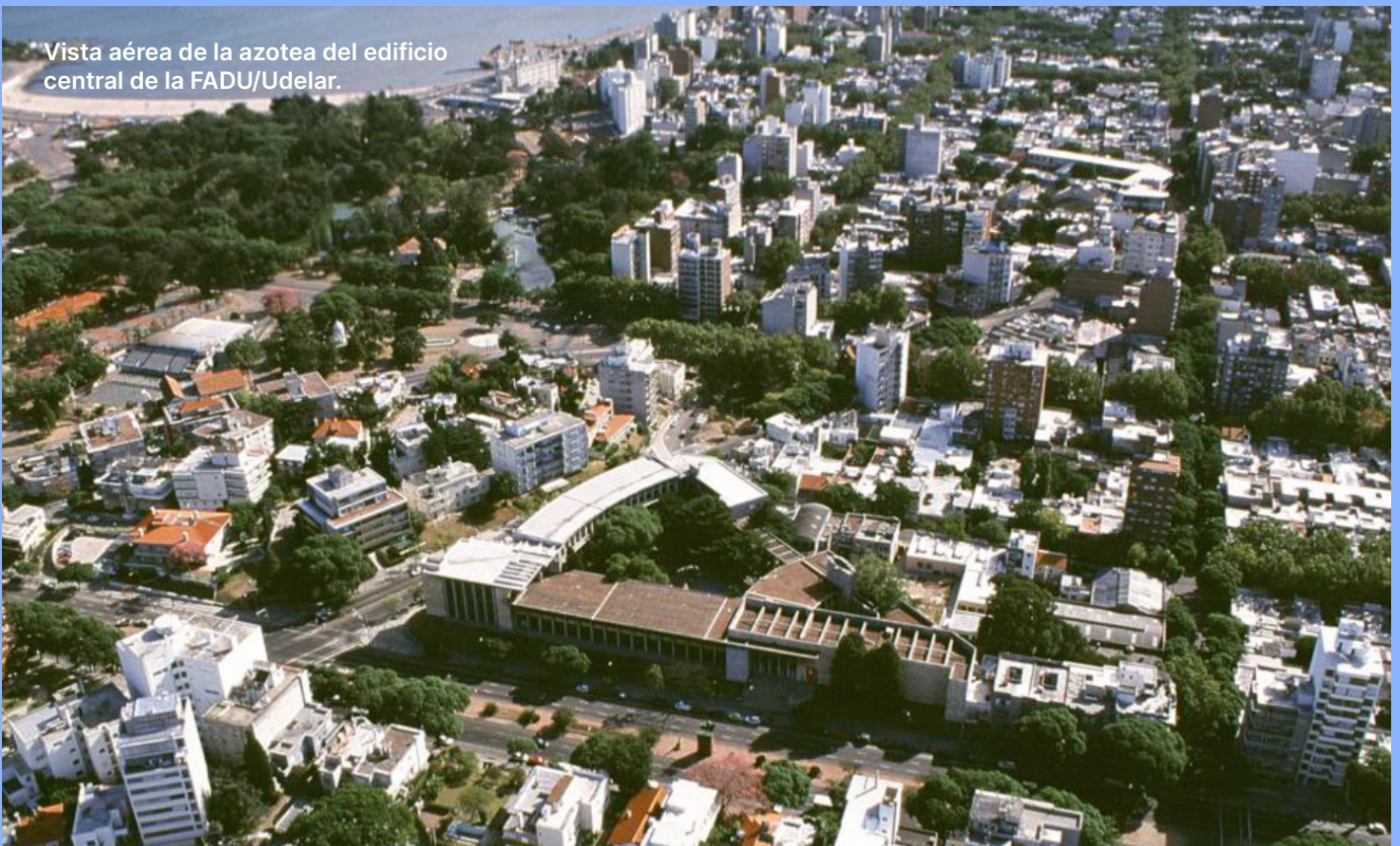
Vista aérea de la azotea del edificio central de la FADU/Udelar.

ARQUISUR 2023 tendrá lugar en la sede histórica de la FADU/Udelar, que se transformará a través de una serie de instalaciones temporales que modificarán y ampliarán los usos habituales de sus espacios. La intervención principal para el encuentro ARQUISUR será en su potente azotea, que desde hace más de 20 años dejó de ser accesible al público, y que será re-abierta y re-ocupada por la comunidad académica, el barrio y la ciudad toda.