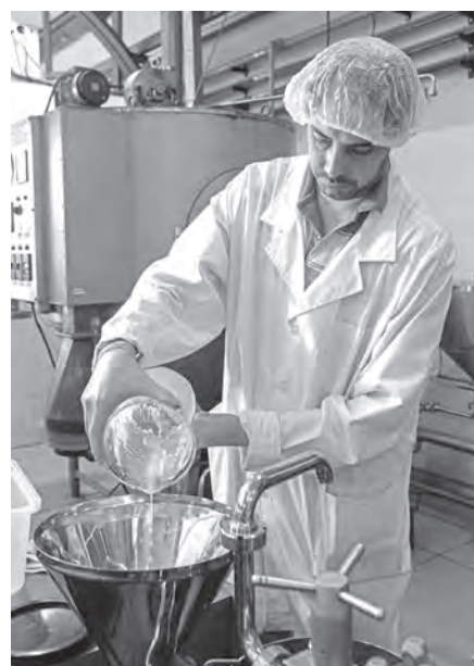
Investigadores en el laboratorio del ITA donde procesan el lactosuero.

Cabe destacar que el proceso desarrollado para quesos untables tiene el doble de rendimiento y de producción que la metodología tradicional. Para poder realizarlo, utiliza equipamiento habitual de las industrias queseras.