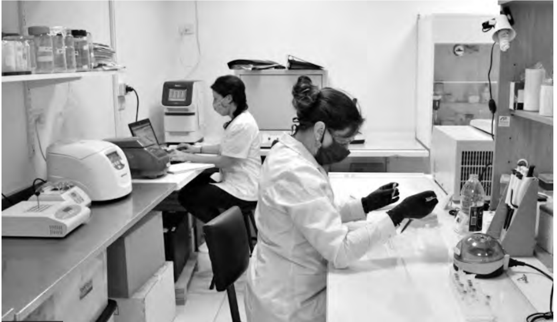
Investigadoras del Laboratorio de Ecología de Enfermedades de la fcv.